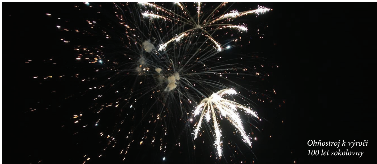
Ohňostroj k výročí 100 let sokolovny