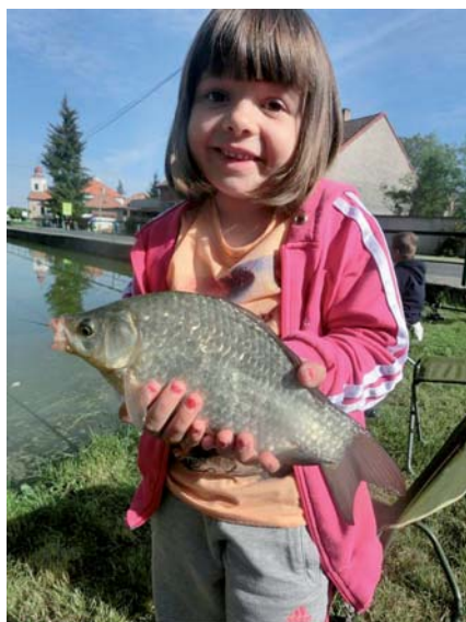
Dětské rybářské závody