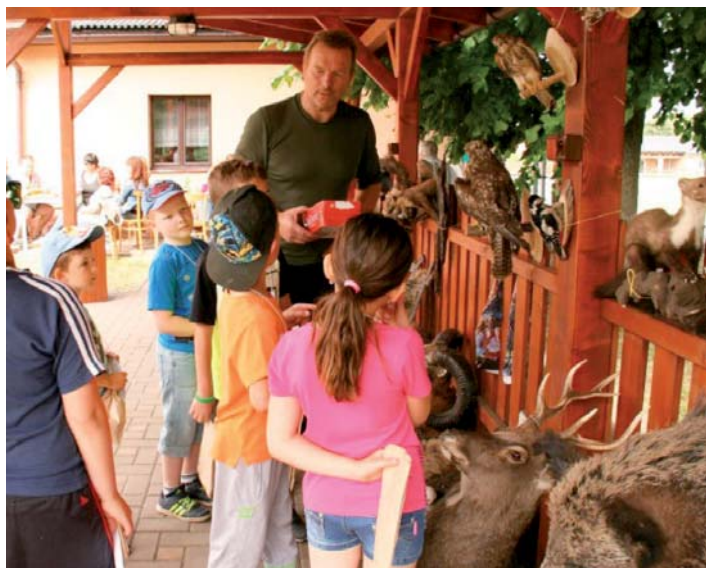
Dětský den s mlivci