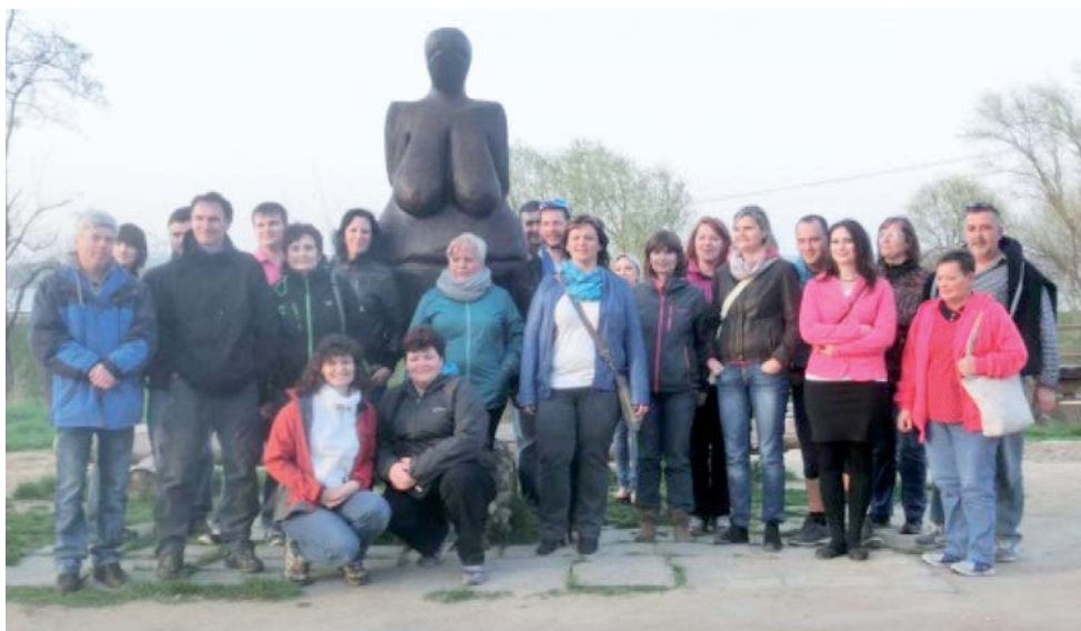
Zájezd do Mikulova