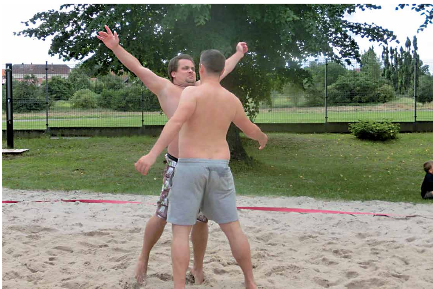
Volejbal – radost z bodu