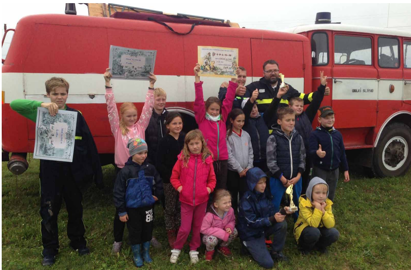
Dětské hasičské závody