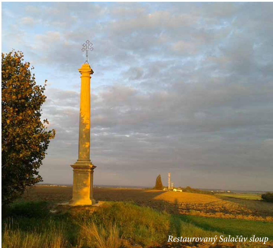
Restaurovaný Salačův sloup