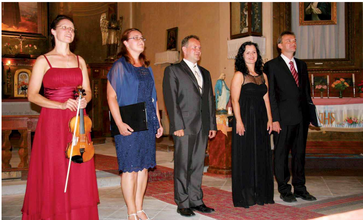
Večerní chrámový koncert