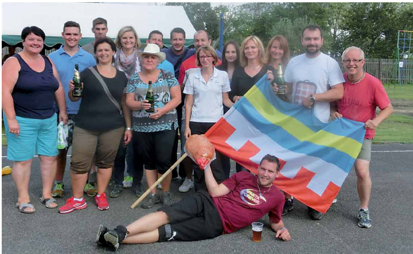
Slivna v sobě, vyrovnáno na 1:1