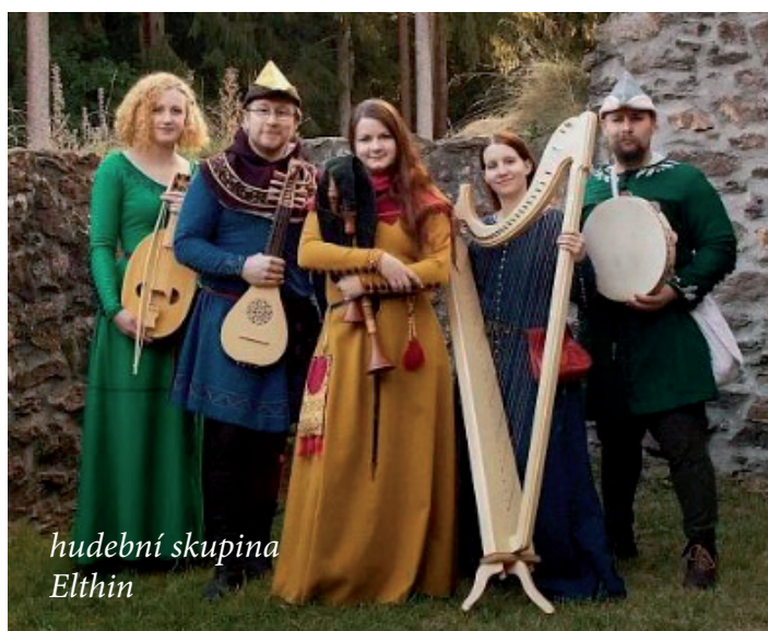
hudební skupina Elthin